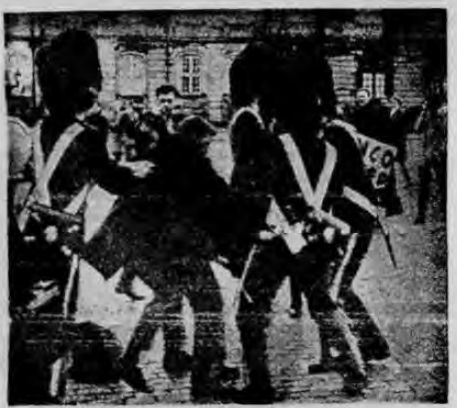
COPENHAGUE, abril 21 (AP).—Manifestantes rompieron un cordón policial hoy y cruzaron la plaza frente al Palacio Real con cartelones que protestan contra el golpe militar en Grecia. Intervino entonces la Guardia Real.

La agencia de noticias oficial del régimen comunista dijo que Alemania ha sido dirigida contra los intereses de la nación alemana.