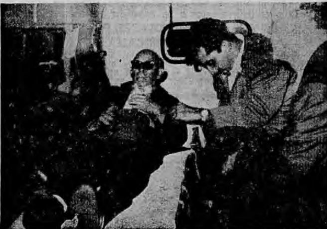
Tres heridos cuando eran conducidos en una ambulancia al hospital San Juan de Dios, fueron fotografiados por la cámara de LA REPUBLICA anoche.