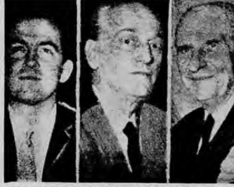
Abril 21 (AP).—El Rey Constantino, de Grecia, y el Primer Ministro Panayiotis Canallópoulos firmaron una proclama que puso al ejército en control del país hoy para contrarrestar las tentativas de los izquierdistas contra la monarquía. El golpe militar termina una brega por el poder entre el Rey y el ex Primer Ministro George Papandreou y su hijo, Andreas.

Barrientos dijo que "el castrocomunismo hace el festín de los millones de dólares, para interrumpir el desarrollo de nuestros países" y mencionó que "uno de los guerrilleros fue encontrado con cerca de 2,000 dólares en el bolsillo, lo que demuestra que es por dinero que vienen a asesinar a la gente de Bolivia".