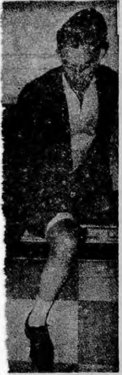
Vecino de Tibás, fue otro de los asistentes al acto de anoche. Aquí lo vemos cuando se atendió nuevamente en la Juan de Dios.