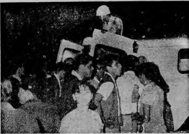
Minutos después de la explosión de la bomba anoche en el Parque Morazán, el fotógrafo de LA REPUBLICA registró la instantánea cuando eran introducidos a una de las ambulancias de la Cruz Roja, algunos heridos, para conducirlos al San Juan de Dios.