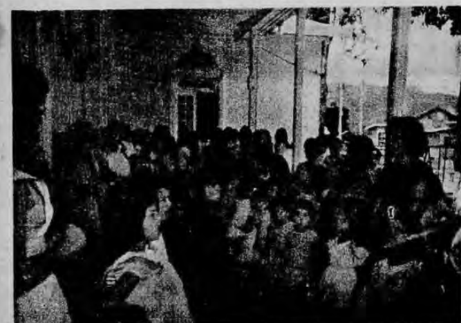
La fiesta de la madre, todos los años, es ya tradicional, y como se de esperarse, se celebra con todo entusiasmo.