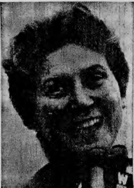
Svetlana Stalin, la única hija del dictador José Stalin, que fue amo absoluto de la Unión Soviética, hace declaraciones a la prensa al llegar al aeropuerto Kennedy en Nueva York, ayer viernes. Se especula que Svetlana pedirá asilo político en Estados Unidos.