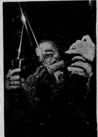
Un Gato de F.B.I

... Hemos recibido una valiosa colaboración suscrita por XYZ. Es una observación honesta sobre las últimas actividades del periodismo radiofónico y que publicamos porque constituye un estímulo para quienes se dedican a esa labor.