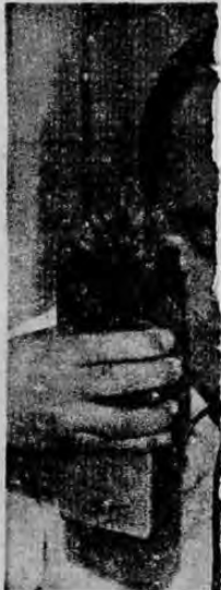
El Ministro de la Presidencia anoche a una conferencia con todos los esfuerzos posibles de terrorismo.

Con carácter urgente fue convocada LA REPUBLICA telefónicamente por el Ministerio de Seguridad para una conferencia de Prensa que ofreció el Mi-