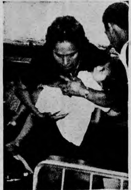
OTRA VICTIMA DEL QUESO EN MAL ESTADO. — Es bajada por su madre de una de las ambulancias de la Cruz Roja, en que fueron trasladadas al Hospital Nacional de Niños, para recibir las atenciones médicas del caso.